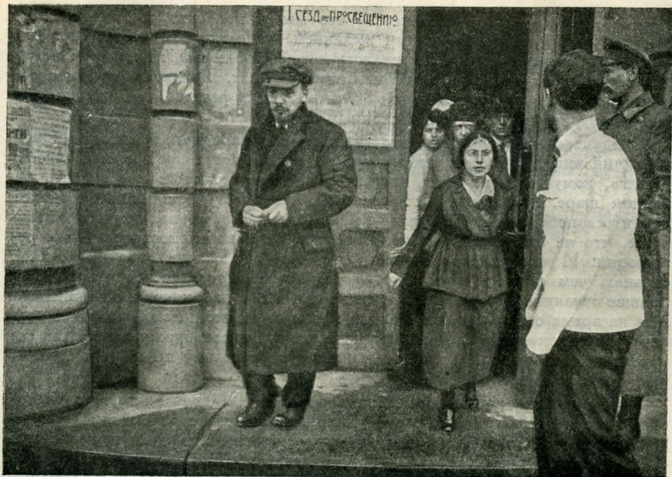
ЛЕНИН НА I СЪЕЗДЕ ПО ПРОСВЕЩЕНИЮ 28 АВГУСТА 1918 г.