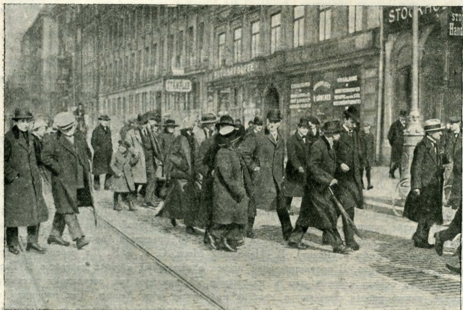
ЛЕНИН НА УЛИЦАХ СТОКГОЛЬМА 1/14 АПРЕЛЯ 1917 г. ПРОЕЗДОМ ИЗ ШВЕЙЦАРИИ В РОССИЮ

Изложение речи Ленина на огромном десятитысячном митинге на Путиловском заводе 25 (12) мая, приводимое ниже, до сих пор не переиздавалось. В «Правде» от 25(12) мая есть объявление о выступлении в этот день на митинге протеста на Галерном Островке против приговора над Фридрихом Адлером. В №№ «Правды» от 26 (13) и 27 (14) мая и в № 22 «Солдатской Правды» от 27 (14) мая 1917 г. дано короткое описание этого митинга, без изложения речей, и приведен текст принятой резолюции. Таким образом в этот день Ленин выступал на двух митингах. Каких-нибудь