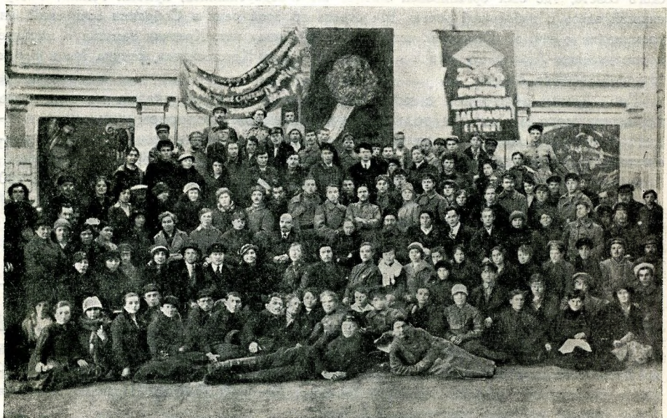
ЛЕНИН И Н. К. КРУПСКАЯ СРЕДИ УЧАСТНИКОВ КОНФЕРЕНЦИИ КУРСАНТОВ-ВНЕШКОЛЬНИКОВ ПЕРЕД ОТПРАВКОЙ НА ФРОНТ 27 ОКТЯБРЯ 1919 г.

Тов. Ленин говорил о письме члена Учредительного собрания, правого эсера, видного сотрудника «Воли Народа» и секретаря Керенского Сорочкина, признающего политику своей партии вредной. Письмо это означает глубокий перелом в настроении известной части русского общества, видевшей в политике большевиков гибель России, особенно после Бреста. Люди эти