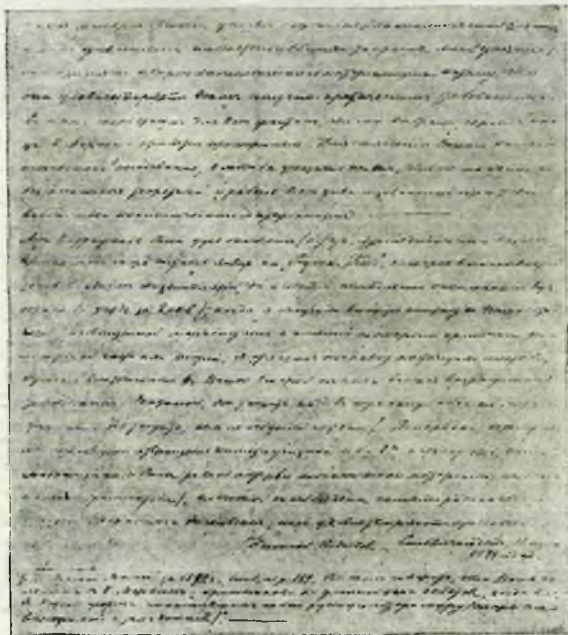
ПОСЛЕДНЯЯ СТРАНИЦА ВТОРОЙ ЧАСТИ ТОГО ЖЕ ПИСЬМА

О подлинника, хранящегося в Институте Новой Русской Литературы