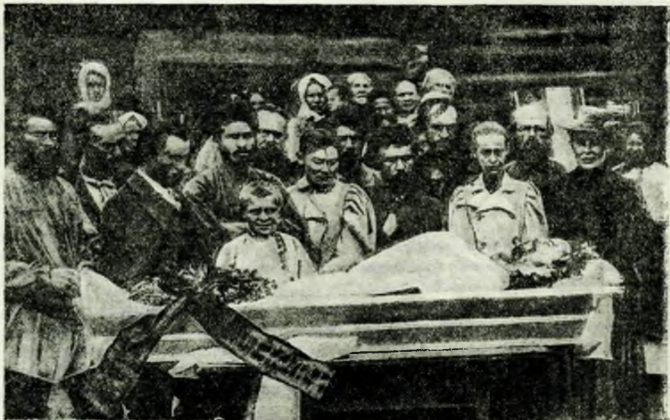
Н. Е. ФЕДОСЕЕВ В ГРОБУ Верхневолоцкий, июнь 1898 г.

Дальше Федосеев цитирует мнение Добролюбова о «старых авторитетах»: эти «старые авторитеты, воспитанные в старых убеждениях, не понимают новой жизни и употребляют весь свой талант на внедрение старых своих идеалов в новую жизнь. Но новая жизнь, новая молодежь брала свое. Она отворачивалась от «старых авторитетов» и шла самостоятельной дорогой, хотя бы и ошупью».