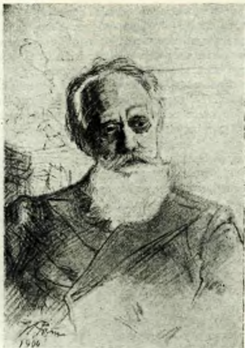
Н. К. МИХАЙЛОВСКИЙ

Тревожит Михайловского и нечеткость постановки вопроса «экономической организации, обеспечивающей трудящемуся (крестьянину) самостоятельное положение»