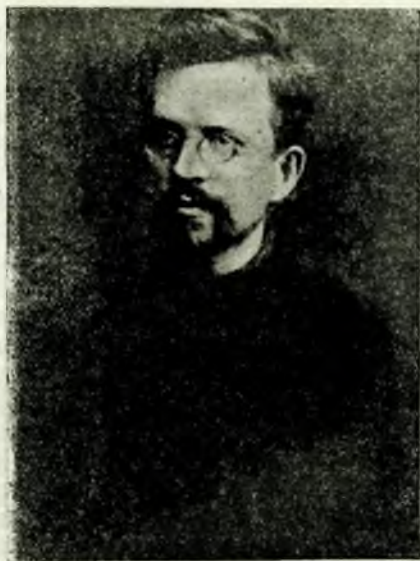
Н. Е. ФЕДОСЕЕВ В СЫЛКЕ В СОЛЬВЫЧЕГОДСКЕ

«Многоуважаемый Николай Константинович! Я должен извиниться перед Вами. В своем письме, подписанном инициалами Н. Ф., я говорил, что мне неприятно обращаться к Вам с «личным частным письмом», потому что я, причисляющий себя к столь ненавистным Вам «русским марксистам», чувствовал себя оскорбленным Вашими «нелитературными выражениями» насчет русских марксистов. С противником, который бранится, толковать, конечно, неприятно, особенно в частном порядке. Но тут произошло в высшей степени досадное недоразумение; я не имел тогда повода так относиться к Вам. Я имел полную уверенность, что слова («один, два тупоголовых эпигона Маркса — рыцари накопления, с которыми толковать много нечего»), делавшие неприятным для меня личное частное обращение к Вам, сказаны именно Вами. Письмо к Вам я писал наскоро, накануне принудительного путешествия в область «тотемской морощки». Свою ошибку я обнаружил лишь в арестантском вагоне, когда исправить ее уже не