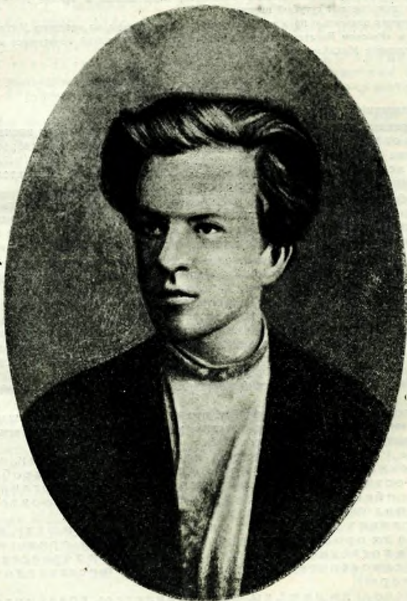
Н. Е. ФЕДОСЕЕВ.