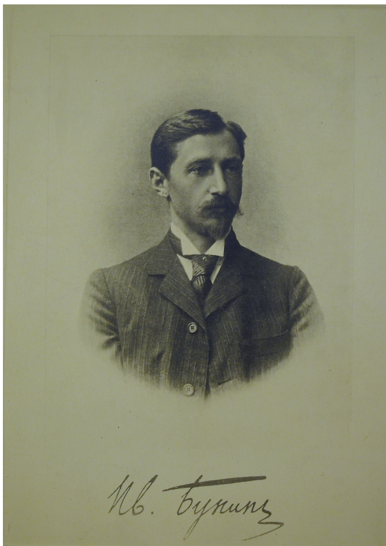
И.А. Бунин. Москва, 1903 г. (РАЛ)