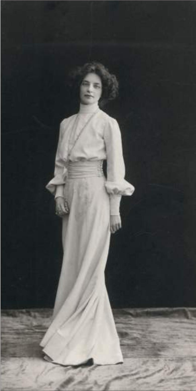
Портрет З.Н. Гиппиус. Фотоателье «Отто Ренар». Москва. 1904 г. Литературный музей Института русской литературы. Санкт-Петербург